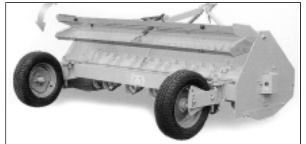
Capot arrière réglable

ATTENTION : le tracteur doit-être équipé d'un distributeur hydraulique à double effet