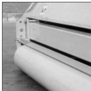
Version avec rouleau réglable

ATTENTION : le tracteur doit-être équipé d'un distributeur hydraulique à double effet